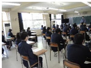
5月の臨時登校日には1年生へオリエンテーションを実施

まだまだ手探りのことが多い新型コロナウイルス対策ですが、ソーシャルディスタンスを意識しながらも心は登高生一丸となって乗り切っていきましょう！