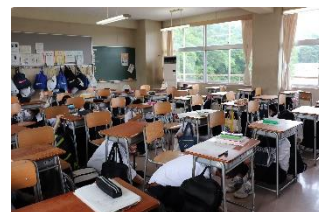
机の下に隠れる生徒たち

6月11日（木）に防災避難訓練を実施しました。今回は避難経路の確認を主な目的として、大地震が起きたことを想定して第1グラウンドへ避難しました。特に1年生にとっては緊急時にどこに避難すればよいかを知る初めての機会であり、防災意識を高めることができました。