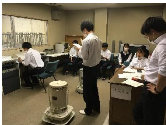
放送室で議事を進行する議長団

6月25日(木)に前期生徒総会が実施されました。3密を避けるため、議長団が放送により議事を進めるという形式で行われ、今年度の生徒会予算案や各委員会の活動目標などの重要な議案が審議されました。採決を取る場面では、各教室の状況を廊下に待機した生徒会役員が集計して放送室の議長団へ伝達するなど、生徒たちの工夫が見られました。