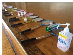
体育のバドミントンの授業も用具を消毒しながら