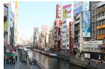
昨年の修学旅行で撮影した道頓堀

2年生にとって一大イベントである修学旅行ですが、新型コロナウイルス感染症に終息の兆しが見えないことから、 残念ながら中止 となりました。学校としてもギリギリまで判断を遅らせましたが、目的地としていた関西方面の感染状況を踏まえると計画通りの実施は難しいという結論にいたりしました。10月には生徒と保護者に周知し、11月にはアンケートをとって代替行事も模索しましたが、感染症の流行が止む気配もないことから遠足等の行事も実施しないこととなりました。