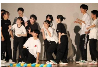
実行委員によるダンス

「準備は間に合うのか」「盛り上がるのか」という不安は日に日に薄くなっていきました。夏休み前から生徒の目がキラキラはじめ、土日にも準備のために登校する生徒や実行委員の姿がありました。「これは期待以上のものが見られるかも」