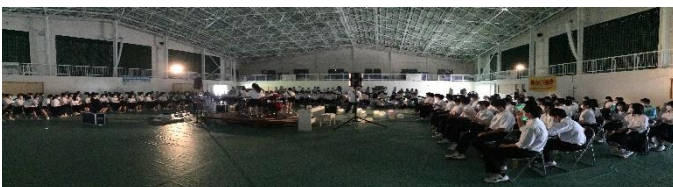
軽音楽部の演奏時の体育館全体

9月2日（金）の校内発表、開会行事の後、有志のダンスで文化祭が幕を開け、吹奏楽部や軽音楽部の軽快な音楽に合わせて手拍子をしたり、体を動かしたりと思い思いに楽しい時間を共有しました。また、多くの先生方が飛び入り参加してくれて、会場は笑い感動に包まれました。