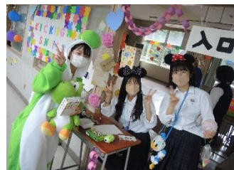
盛り上げようという気概あふれる生徒達

そして、いよいよお客さんを入れての一般公開となった9月3日（土）が始まりました。手探りしながら仲間と協議し、協力し合って何とか形にしたけど、人は来てくれるのか？