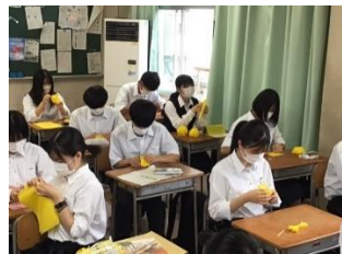
朝の時間にみんなで作業

「準備は間に合うのか」「盛り上がるのか」という不安は日に日に薄くなっていきました。夏休み前から生徒の目がキラキラはじめ、土日にも準備のために登校する生徒や実行委員の姿がありました。「これは期待以上のものが見られるかも」