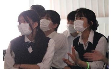
動画に見入る生徒達

クラス企画では「動画上映」を行い、それぞれが個性あふれる動画を作成して発表しました。クラスの仲の良さや、3年生の弾ける笑顔が印象的でした。動画を見る生徒達も真剣そのもので、食い入るように見て、拍手を送っていました。