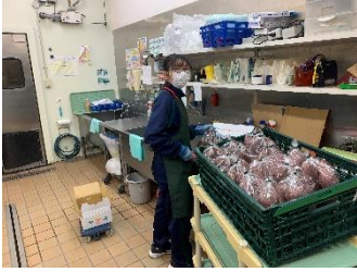
ウジエスーパー中田店

参加した生徒からの感想です。「保育士は子ども達から目を離してはいけない大変な仕事だけれども、やりがいもしっかりあって、すごく良い仕事だと思いました」「今回、本当に良い経験になりました。とても緊張しましたが、職員の方がとても優しく、詳しく説明してくれたので、楽しく仕事できました」