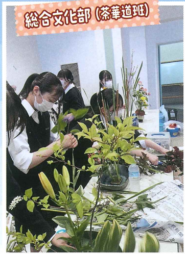
総合文化部(茶華道班)