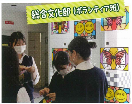
総合文化部(ボランティア班)