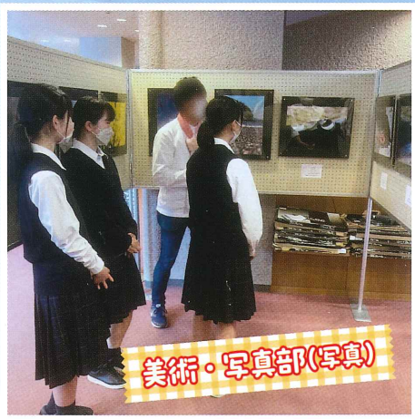
美術・写真部(写真)