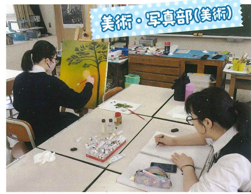
美術・写真部(美術)