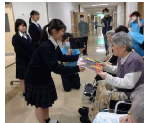
特別養護老人ホーム「光風園」