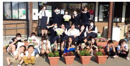
寄せ植えプランター寄贈「登米児童館」