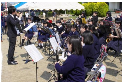
中学・高校合同チームで息の合った演奏を披露

5月14日(土)、登米小学校で開催された運動会への協力として、本校吹奏楽部と登米中学校吹奏楽部が合同で生演奏をしました。入場曲や君が代、勝利を称える歌、退場曲と、息の合った演奏を披露し、運動会を盛り上げました。