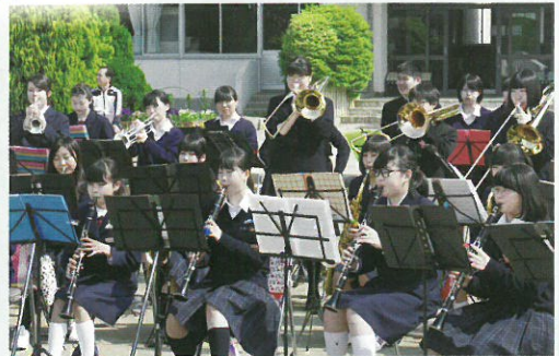
登米小運動会で吹奏楽部生演奏♪