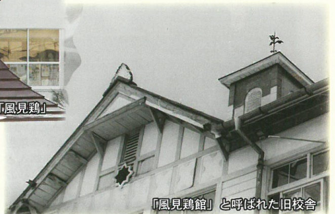
「風見鶏館」と呼ばれた旧校舎